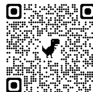
体育・健康教育地区 公開講座アンケート