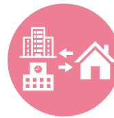
関係機関と 連携した支援