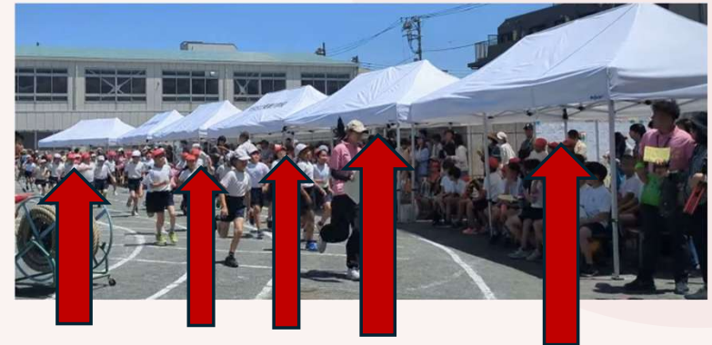
運動会でこどもたちを強い日差しから守るテント (複数年かけて購入)