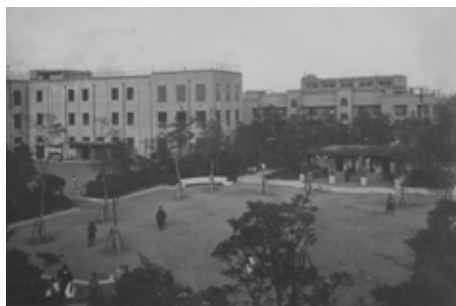
震災復興小公園 - 元加賀小学校と元加賀公園 1927年竣工