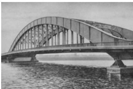
震災復興橋梁 - 永代橋 1926年竣工

ことは、1923年(大正12年)9月1日に関東大震災が発生してから、 100年を迎える年です。東京都では、都民の皆様と一緒に 防災について考え、「100年先も安心」を目指して取組を推進していきます。