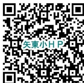
今年の漢字 2023 HPサイト

「学校のきまり」をHP上に掲載しました。 学校生活上、最低限守ってほしいことです。 誰もがそのきまりを守りながら気持ち良く生活を送れるようにご家庭でもご協力ください。