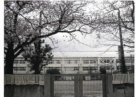
＜南門からの校舎の風景＞

このような、いつもと違った新学期を迎えましたが、今年度も本校の教育目標である「学ぶ・鍛える・思いやる」を大切にして、「学力向上」、「自己有用感・自己肯定感」、「主体性と自治力」、「コミュニケーション能力」等を育めるように指導の工夫や充実を図っていきたくと思います。